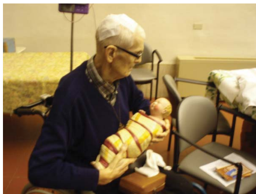
Santa Umiltà e le sue consorelle, nella semplicità delle loro anime, se lo rubavano a vicenda per con-