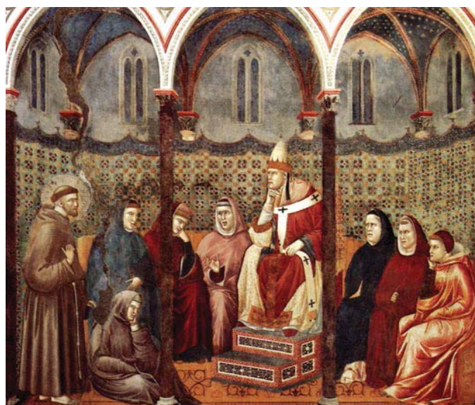
Giotto, Storie di San Francesco , Assisi

Vorrei la voce di San Francesco per aprire correnti azzurre ove gli esuli della terra ritrovassero Te Padre, onnipotente e buono.